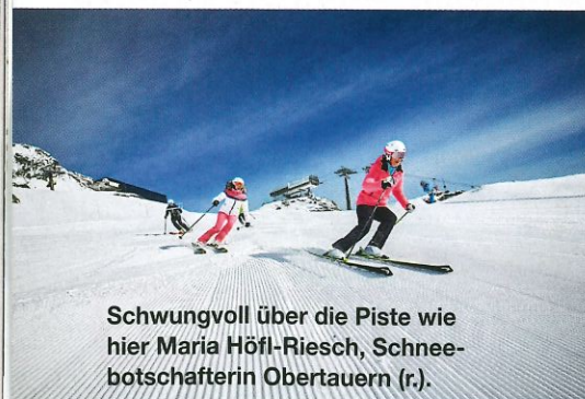
Schwungvoll über die Piste wie hier Maria Höfl-Riesch, Schneebotschafterin Obertauern (r.).