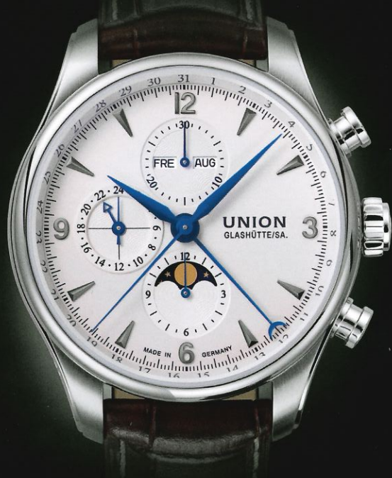
BELISAR CHRONOGRAPH MONDPHASE

SEIT 125 JAHREN ENTSTEHEN MIT PRÄZISION UND LEIDENSCHAFT WAHRE KUNSTWERKE.